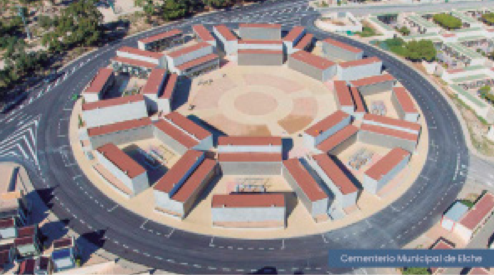
Cementerio Municipal de Elche